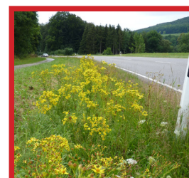
blühendes Jakobskreuzkraut (Bankettzone)

Regulierungsmaßnahmen sind durchzuführen, wenn: